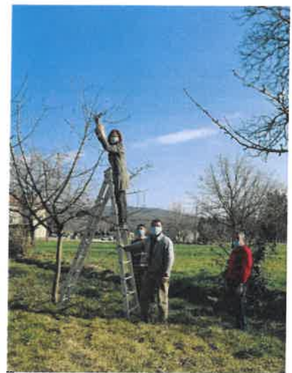
Bénévoles et élus prennent soin du verger